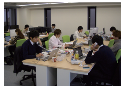
オフィス風景。簡単な設定とシンプルな構成で、可動性にも優れている。

※1 FreePBX とは、WEB インターフェース上から Asterisk の設定や管理を 簡単に行うことが出来るソフトウェアです。