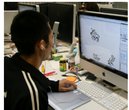
両手を空けて作業中。

Asterisk+FUSION IP-Phone は着信チャネル数が無制限なので、話し中を気にすることもなく、兼ねてから抱えていた課題も解決された。